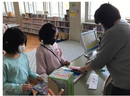
休み時間に本を借りる子ども達

また、今年から項目に「読書の時間」を追加いたしました。生活の中にぜひ読書を入れてほしいとの思いからです。コロナ禍だからこそ、本の中で、時間や空間を超えた世界を体験してほしいと思います。その際は、ぜひ学校や公民館の図書室をご活用ください。本校の図書室は、約9,000冊の蔵書を有しており、毎年たくさんの新刊も入り、図鑑や紙芝居などから歴史まんがや本格的な小説まで、ジャンルも多様でとても充実しています。図書室の担当者や図書委員会の子ども達は、本を手に取りやすいように新刊コーナーを設置したり、選びやすいように本を整理したりしています。これからは学校や家庭での読書の習慣化が図られるよう環境を整えてまいります。