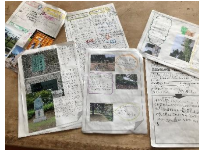
3年生の東山公園調べ

東山公園に行って、植物や風景、石碑などの写真をたくさん撮ってきた3年生。記録用紙には、絵やイラスト、写真がたくさん貼られていました。