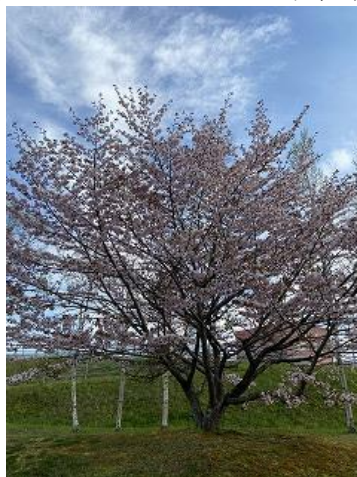
5月17日撮影 体育館前の桜が綺麗でした。

さて、開校まで3か月を切りました。新校舎も着々と工事が進められています。昨年11月に第1回保護者説明会を開催し、学校理念や教育方針、特色ある教育活動などをお伝えするとともに、参加された保護者からもご意見やご要望等をいただき、開校準備に反映させていただきました。また、記念事業協賛会や学校運営協議会（コミュニティースクール）準備会なども発足し、協議や活動を進めているところです。年度が変わり、新しい教職員体制の中で、学校の時程や持ち物、校内生活のきまりなど、白糠学園での生活を始めるうえで重要となる具体的な内容を協議し決定してきました。このことについて、担当教員から直接保護者の方々にお伝えする「第2回保護者説明会」を6月27日（月）に開催いたします。子どもたちがよりよい学園生活を送ることができるよう、学校・保護者・地域が一体となって教育環境を整えてまいります。ぜひご参加いただきますようお願い申し上げます。