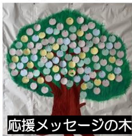
応援メッセージの木