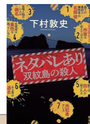
ネタバレあり 双紋島の殺人 作者：下村敦史