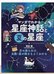
マンガでわかる 星座神話と夏の星座 作者：塚田健