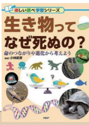
生き物ってなぜ死ぬの? 作者：小林武彦