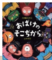
おばけのそごちから 作者：山本孝