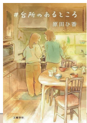
#台所のあるところ 作者：原田ひ香