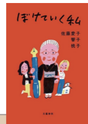
ぼけていく私 作者：佐藤愛子