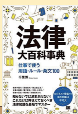
法律大百科事典 仕事で使う用語・ ルール・条文100 千葉 博