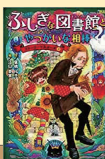
ふしぎな図書館と やっかいな相棒 廣嶋 玲子