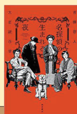
名探偵の生まれる夜 大正謎百景 青柳 碧人