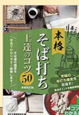
これで差がつく!本格 そば打ち上達のコツ50 手打ち蕎麦研究会