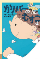
ガリバーのむすこ マイケル・モーパゴ