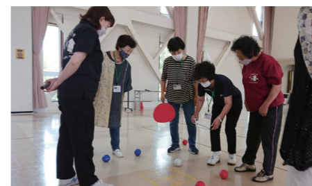
レクリエーション「ポッチャ」の様子

入学資格/60歳以上の町民 ※60歳未満でも予備生として入学できます。 年会費/1,000円 申込/社会福祉センターにある入学願書に必要事項を記入し、3月22日(水)までに提出してください。 開講式/4月12日(水) 10時~ 会場/社会福祉センター大会議室 問合せ/社会教育課社会教育係 ☎ 2-2287