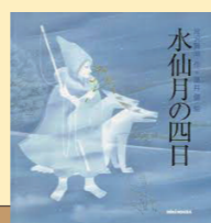
水仙月の四日 黒井 健