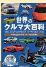
世界のクルマ大百科 スタジオタック クリエイティブ