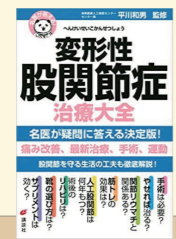
変形性股関節症治療大全 著:平川 和男