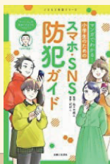
マンガでわかる!小学生のためのスマホ・SNS防犯ガイド 著:佐々木 成三