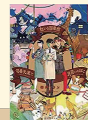
虹いろ図書館司書先輩と見習いのぼく 著:櫻井 とりお