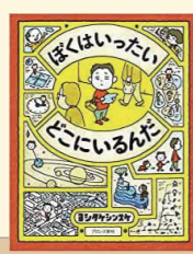
ぼくはいつどこにいるんだ 著:ヨシタケ シンスケ