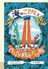
海のこびとウミガメ救出大作戦 著:サリー・ガードナー