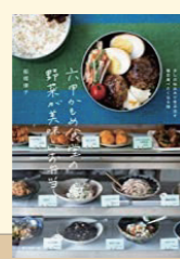
六甲かもめ食堂の野菜が美味しいお弁当 著:船橋 律子