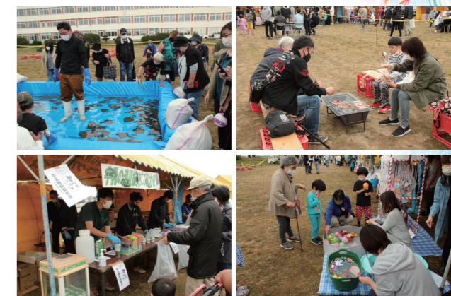
昨年のプチ産業まつりの様子

問合せ先/白糠町産業祭実行委員会事務局(釧路丹頂農業協同組合青年部音白支部) ☎ 2-2235 (釧路丹頂農業協同組合白糠営農課)