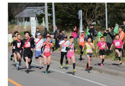
2019年の駅伝競走大会の様子

申込・問合せ先/社会教育課スポーツ推進係(社会福祉センター内) ☎ 2-2287