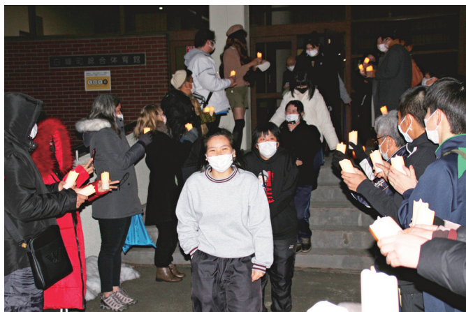
来場者がLEDキャンドルを手に卒業生を見送りました