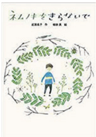
ネムノキをきらないで 著者：岩瀬成子