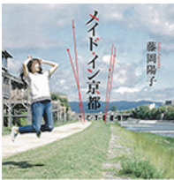
メイド・イン京都 著者：藤岡陽子