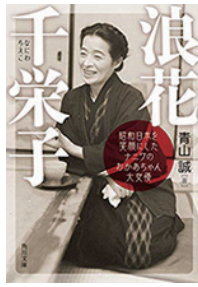
浪花千栄子 著者：青山誠