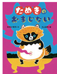
たぬきのおまじない 著者：円山誠司