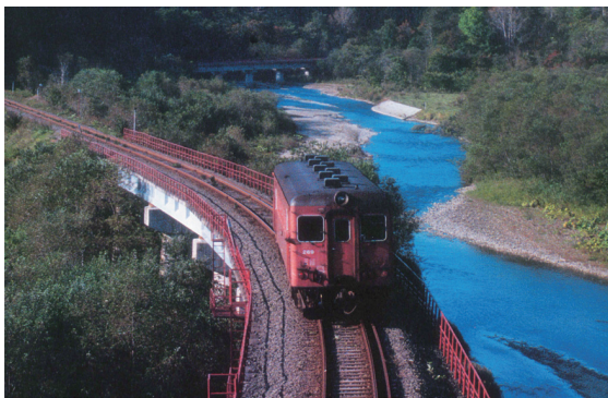
問合せ先/町民サービス課交通対策係 内線(519)

ご協力いただける方は、お手数ですが役場町民サービス課交通対策係 ☎ 2-2171 までご連絡ください。こちらから伺います。