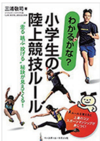
小学生の陸上競技ルール 著者：三浦敬司