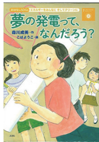
夢の発電って、なんだろう? 著者：森川成美