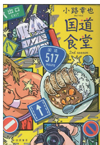
国道食堂 2nd season 著者：小路幸也