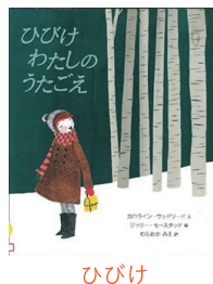
ひびけ わたしのうたごえ 著者：ジェリー・モースタッド

新着図書はこの他にもたくさんあります。町ホームページで紹介していますので、ぜひご確認ください。