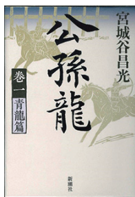
公孫龍 卷1 青龍篇 著者：宮城谷昌光