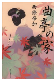
曲亭の家 著者：西條奈加