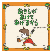
あきらがあげてあげるから 著者：ヨシタケシンスケ