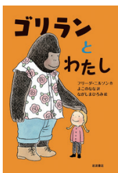
ゴリラんとわたし 著者：フリーダ・コルツ