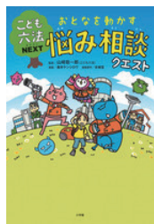
おとなを動かす悩み相談クエスト 著者：山崎聡一郎