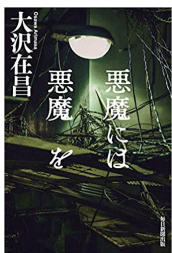
悪魔には悪魔を 著者：大沢在昌