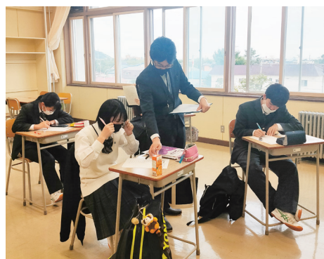
前期期末考査中の塾の様子(英語)

白糠町は、生まれ育った「ふるさと」です。青春を過ごしてきた道を再び久遠塾の講師として通ったとき、昔の記憶を思い出して、懐かしさを感じました。今は、白糠に帰ってこることができて、本当に良かったと思っています。茶路川に戻ってくるサケのように、白糠町に戻ってくることは、自分の役目を果たすためだと思っています。その役目とは、白糠町の子どもたちに『未来』という宝を残すこと、そのために久遠塾の先輩方と一緒に頑張っていきたいと思っています。 私は、自分の経験してきたことを生かして、白糠の子どもたちの選択肢、そして可能性を一つでも広げられるように力添えできたら