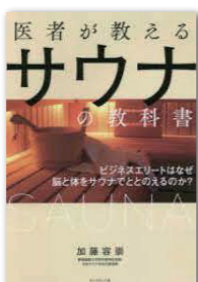
医者が教えるサウナの教科書 著者: 加藤容崇