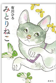
みとりねこ 著者: 有川ひろ