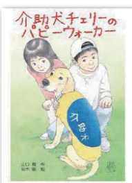
介助犬チェリーのパピーウォーカー 著者: 山口理