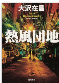
熱風団地 著者: 大沢在昌