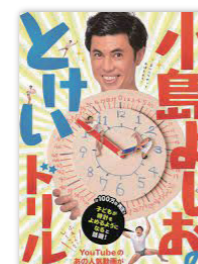
小島よしおのときいドル 著者: 小島よしお