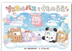
アニマルバスとくものうえ 著者: こてら しほ