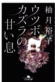
ウツボカズラの甘い息 著者: 柚月裕子