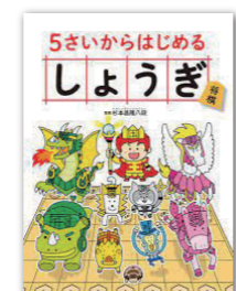
5さいからはじめるしろうぎ 著者: 杉本昌隆

新着図書はこの他にもたくさんあります。町ホームページで紹介していますので、そちらもぜひご覧ください。