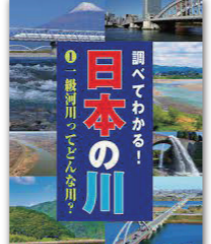
調べてわかる！日本の川 著者：佐久間博