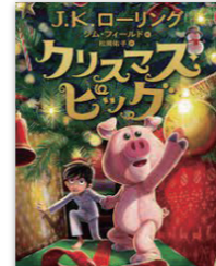
クリスマス・ピッグ 著者：J.K.ローリング