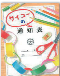
サイコーの通知表 著者：工藤純子