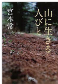
山に生きる人びと 著者：宮本常一