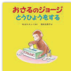
おさるのジョージとうひょうをする 著者：M.レイ