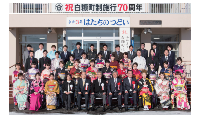
令和3年「はちたのつどい」