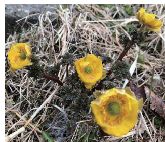
庶路八幡神社の階段横にある フクジュソウ。かれんですね。