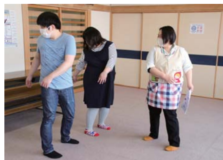
妊婦体操の様子。夫婦で一緒に出産や育児に臨む姿勢を持つことは、とても大切なことです。