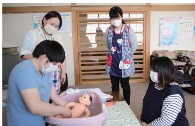
人形を使った沐浴体験。助産師のアドバイスを受けながら学べます。