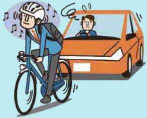
イヤホン等使用運転