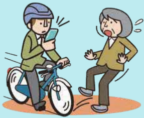
スマホ等使用運転