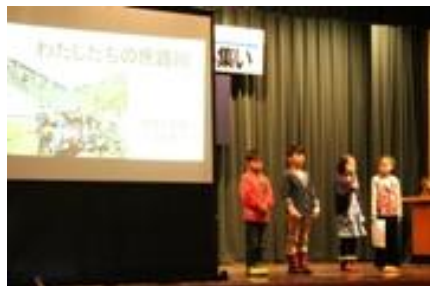
ふるさとと学習の成果を町民に披露する 「明日の青少年を考える集い」（11月）