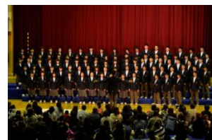
小学校学芸会での中学校全校合唱披露