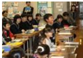
小中合同での ふるさと学習 発表会