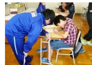
サポート学習会での中学生ボランティア