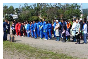
地域と合同での地或清掃