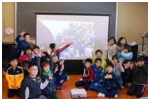
台湾・新北市立青山中小學とのテレビ電話授業