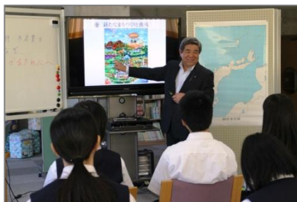
町長による出前講座「新たな町づくり」 (H28 茶路中)