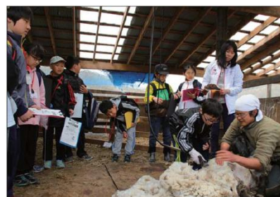
小4～中3まで参加するふるさと未来塾