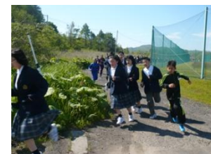
第6学年登校日の小中合同遊戯訓練