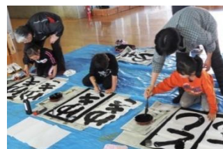
地域の方による 書き初め指導