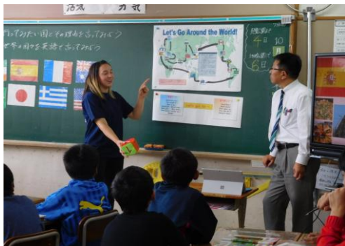
中学校教員とALTによる 小学校高学年の英語の授業