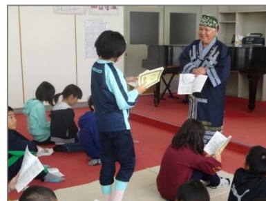
アイヌ文化出前講座を各校で実施