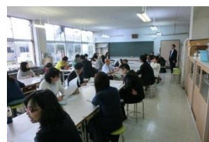
小中教職員の合同研修（H28）