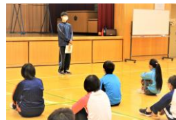
高学年スピーチデイ