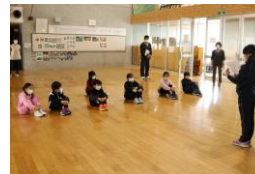
低学年スピーチデイ