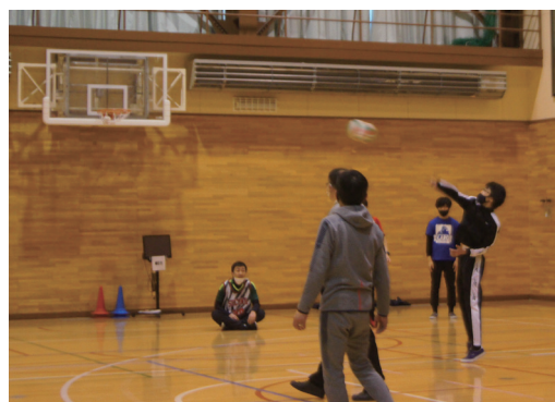
体育祭で「ドッジボール」をしている様子

とですがテレビに映りました。ふるさと納税で白糠町に寄付してくださいのお金の一部は、子育て支援にも使われており、給食費や保育料などが無料になっています。全国の皆さんからの心温まる応援に応えられるよう、塾へ通う生徒たちの努力をしっかりと結果に結びつけていきたいと思えます。この番組をきっかけに「久遠塾」や「白糠高等学校」について、全国の皆さんが興味をもってくれたらとてもうれしいです。