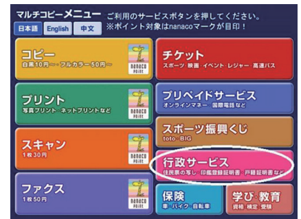
セブンイレブンの画面

はじめに、キオスク端末の画面(右画面参照)に表示されている「行政サービス」ボタンを押してください。次に、利用上の同意事項が表示されるので「同意する」を選択すると、下記①のメニュー選択画面になります。