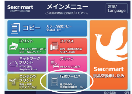
セイコーマートの画面