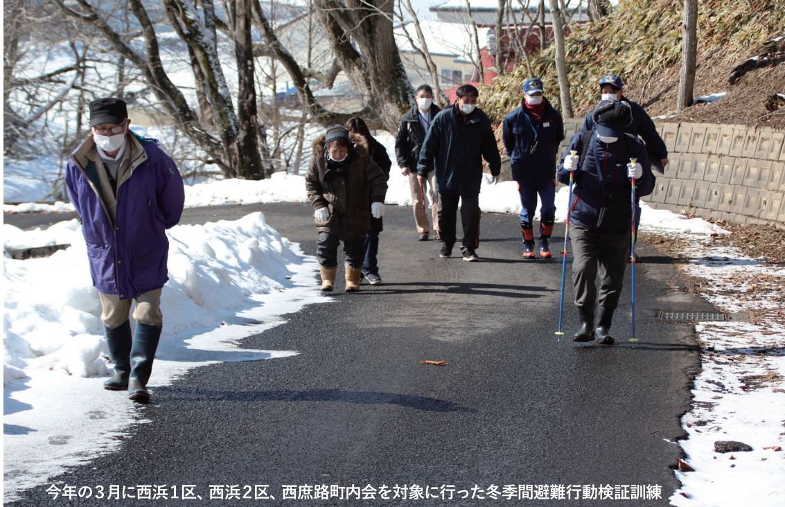
今年の3月に西浜1区、西浜2区、西庶路町内会を対象に行った冬季間避難行動検証訓練