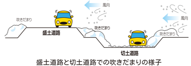
盛土道路と切土道路での吹きだまりの様子

● 道路の形状と吹きだまりの関係 道路には、まわりの土地よりも高い「盛土道路」と、低い「切土道路」があります。一般に、「盛土道路」に比べて「切土道路」では、吹きだまりが発生しやすい傾向にあります。