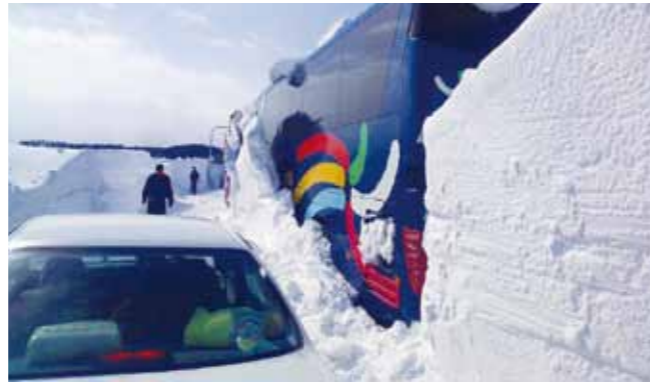
吹きだまりで立往生したバス 北見市常呂町(平成25年3月3日)

風は強いが晴れていると思ったら、雪を伴って一瞬で暴風雪に変わることもあるので、天気の変化には十分注意が必要です。