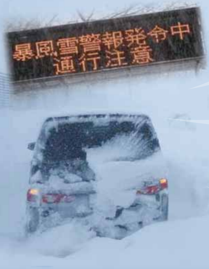
摩周湖~中標津 (平成25年1月27日)