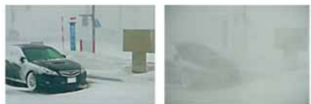
暴風雪で一瞬にして数メートル先が見えなくなる(右) 稚内市内(平成24年4月4日)